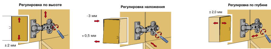
Рис. 3 Схема установки петель

Слегка ослабить крепежные винты ответной планки, выверить по высоте позицию двери. Затем крепежные винты снова затянуть.